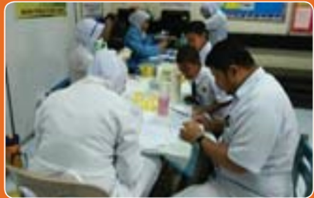
Saringan antropometri & pengambilan sampel urin di SK Bukit Sekilau, Kuantan.