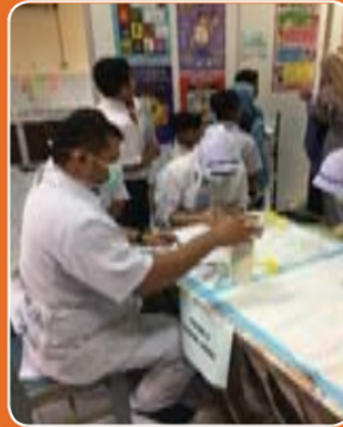
Pengambilan sampel urin di SK Sg Puteri, Kuala Rompin.

Kajian ini merupakan satu kajian peringkat kebangsaan di mana terdapat 2 buah sekolah di negeri Pahang yang telah terpilih untuk dijadikan lokasi kajian