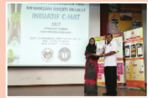
Perasmian Latihan Pemerksaan PIBG Untuk Menangani Masalah Obesiti di Kalangan Murid Sekolah Melalui Inisiatif C-HAT oleh Pegawai Kesihatan Daerah Port Dickson

Antara aktiviti lain yang turut dijalankan adalah pameran Pinggan Sihat Malaysia, pameran kempen buah dan sayur, pameran kesihatan pergigian dan pameran berkaitan keselamatan dan kualiti makanan.