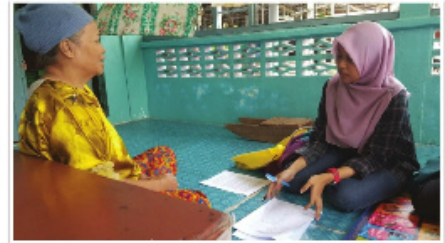
Sesi temubual bersama ibu penerima bantuan bakul makanan