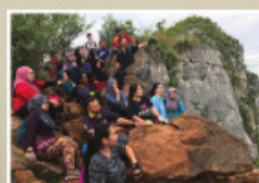
Latihan Kecergasan dan Pengurusan Berat Badan di Puncak Gunung Baling, Kedah