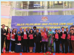
Dato' Seri Dr. Hilmi Bin Haji Yahaya, Timbalan Menteri Kesihatan Malaysia bersama- sama dengan penerima Logo Pilihan Lebih Sihat daripada pelbagai syarikat pengeluar produk makanan dan minuman.

Karnival Pemakanan Sihat dan Majlis Pelancaran Logo Pilihan Lebih Sihat telah diadakan di Aeon Mall Shah Alam, Selangor. Karnival Pemakanan Sihat telah berlangsung dari 18- 23 April 2017 manakala Majlis Pelancaran Logo Pilihan Lebih Sihat telah diadakan pada 20 April 2017 dan dirasmikan oleh Dato' Seri Dr. Hilmi Bin Haji Yahaya, Timbalan Menteri Kesihatan Malaysia. Objektif karnival ini diadakan adalah untuk meningkatkan kesedaran dan kemahiran rakyat Malaysia tentang amalan makan secara sihat dan membantu pengguna membuat pilihan yang lebih bijak melalui logo pilihan lebih sihat. Antara aktiviti yang dijalankan adalah saringan kesihatan, saringan kecergasan, nasihat pemakanan, pameran Pinggan Sihat Malaysia, Makan Buah & Sayur, Kesedaran Kalori dan Perkhidmatan Pemakanan yang lain. Selain itu, terdapat juga aktiviti yang dijalankan di pentas setiap hari sepanjang karnival berlangsung seperti pertandingan mewarna Pinggan Sihat Malaysia untuk kanak-kanak, perkongsian ilmu berkaitan pemakanan seperti Penyusuan Susu Ibu & Makanan Pelengkap, Pemakanan Kanak-kanak & Obesiti, Modifikasi Diet, Pengurusan Berat Badan dan Fad Diet.