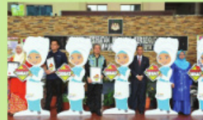
Standee Kafeteria Sihat yang comel