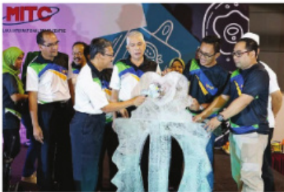
Majlis Perasmian Expo Melaka Sihat 2017