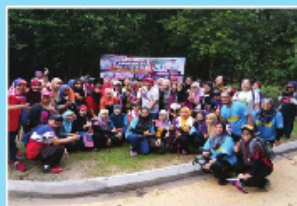
Sesi pendakian merdeka di Bukit Kiara, Kuala Lumpur pada 26 Ogos 2017 sempena sambutan Bulan Kemerdekaan peringkat Kementerian Kesihatan Malaysia.