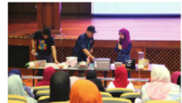
Demonstrasi masakan sihat oleh Chef Eksekutif daripada Majlis Sukan Negara sempena Seminar Kawal Kalori di Aidilfitri