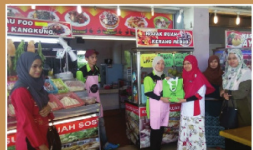
Lawatan ke Gerai Jualan dan Kempen Kesedaran Pengambilan Makanan mengikut Keperluan Kalori