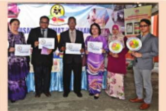
Pameran #SukuSukuSeparuh oleh Pusat Maklumat Pemakanan Daerah Keningau.