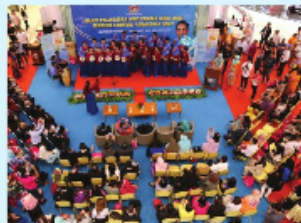
Skitar Majlis Pelancaran Logo Pilihan Lebih Sihat Sempena Karnival Pemakanan Sihat