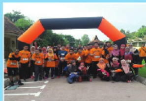
Program Fun Run dan Majlis Penutup Program Trim & Fit pada 4 November 2017 di Taman Wetland, Putrajaya.