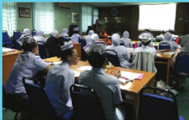
Penyampaian Topik On Going Support for Mothers- Step 10 oleh Pegawai Sains (Pemakanan).

Selain mempelajari teori penyusuan ibu, para peserta turut mempelajari teknik penyusuan secara praktikal. Terdapat sesi amali yang menggunakan anak patung untuk mempelajari teknik posisi yang betul dan pemberian susu menggunakan bekas/ cawan kepada bayi. Sesi demonstrasi membancuh susu formula dengan selamat juga dilakukan oleh semua peserta kursus.