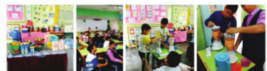
Penglibatan aktif murid semasa aktiviti Dapur Sihat (membuat jus buah-buahan)