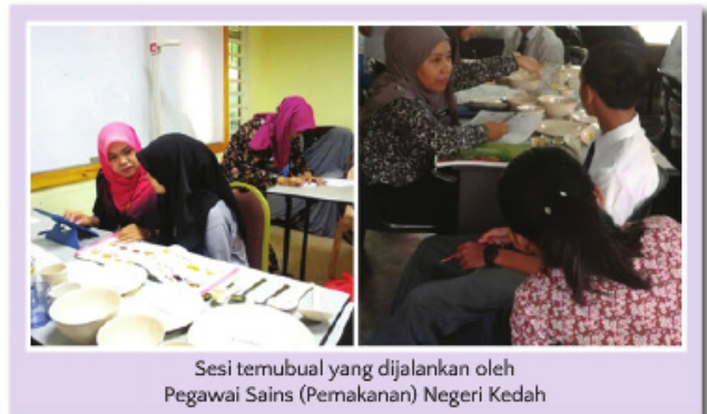
Sesi temubual yang dijalankan oleh Pegawai Sains (Pemakanan) Negeri Kedah