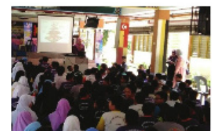
Ceramah Pemakanan Sihat yang disertai oleh semua guru dan murid Tahap 2.