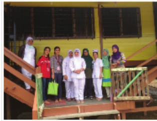
Pasukan penyelidik bergambar bersama anggota kesihatan semasa aktiviti pengumpulan data di Zon Sarawak