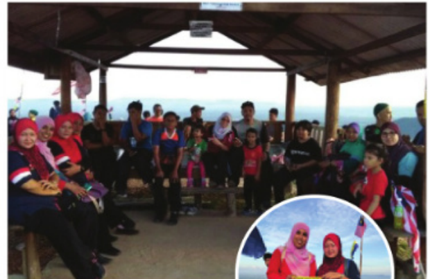
Kelab Warga Emas dan DSM menawan Bukit Tok Dun dengan kerjasama Hikers Club

DSM merupakan salah satu program di bawah National Plan of Action Nutrition of Malaysia III (2016-2025) yang bertujuan untuk meningkatkan taraf pemakanan keluarga dan komuniti dengan penglibatan komuniti serta smart partnership dengan agensi luar. Sepanjang tahun ini, DSM Simpang Empat telah berjaya menjalankan beberapa aktiviti pemakanan hasil kerjasama dengan beberapa agensi luar seperti Pejabat Mufti Perlis, Hikers Perlis, Kelab Warga Emas Simpang Empat, Pusat Pemulihan Dalam Komuniti (PDK) dan PERMATA.