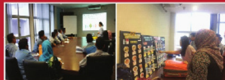
Ceramah Dan Pameran Pemakanan Sihat Di JFE Shoji Steel Malaysia Sdn.Bhd