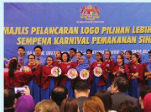
Pasukan Koir Sekolah menyanyikan Lagu Suku Suku Separuh