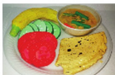
Contoh replika makanan berkonsepkan Pinggan Sihat Malaysia