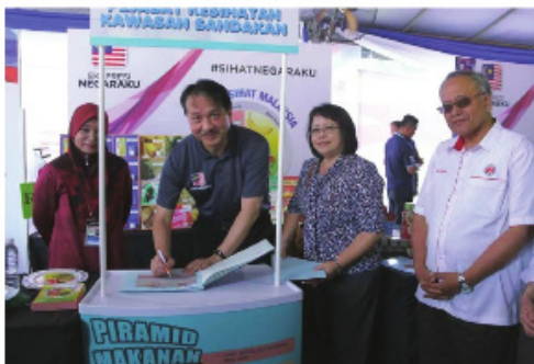
Lawatan YBhg Ketua Pegawai Kesihatan ke booth pameran Unit Pemakanan JKN Sabah