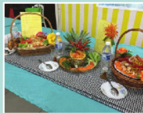
Hasil masakan para peserta dalam Pertandingan Penyediaan Hidangan Sihat bertemakan resipi kerabu