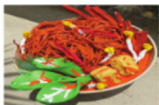
Contoh replika makanan yang disediakan