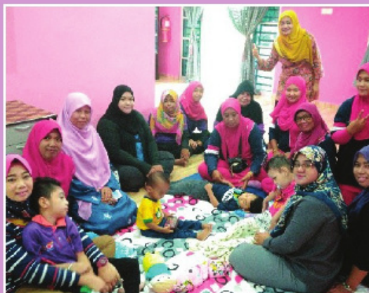
Beriadah dan Sembang Santai bersama Pelatih dan Kelab Sokongan Palsi Serebral di PDK Sanglang