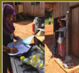
Pengambilan sampel urin dan penilaian antropometri bagi Kajian GAKI di kalangan Ibu Berumur Produktif di Kampung Tohoi, Gua Musang