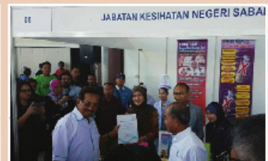
Datuk Musa Aman, Ketua Menteri Sabah menyampaikan sijil penghargaan kepada Pegawai Sains Pemakanan, KKIA Kota Marudu.