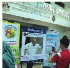
YB Datuk Rozman Hj Isli; Ahli parlimen Labuan bergambar di photobooth pemakanan.

Pameran Pemakanan Sihat telah berlangsung pada 17 Jun 2017 bertempat di Kompleks Sukan Laut Antarabangsa WP Labuan sempena Program Nafas Baru Bermula Ramadan. Pameran telah dirasmikan oleh YB Datuk Rozman Hj Isli, Ahli Parlimen Labuan.