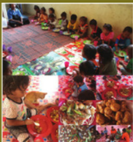
Pemberian makanan di Pusat Community Feeding , Gua Musang