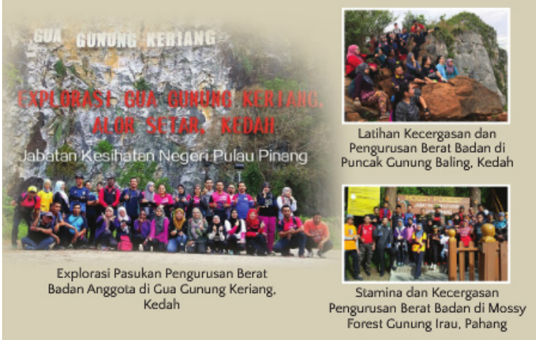
GUA GUNUNG KERIANG EXPLORASI GUA GUNUNG KERIANG, ALOR SETAR, KEDAH Jabatan Kesihatan Negeri Pulau Pinang