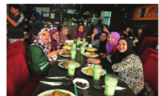
Sesi bergambar berkumpulan sementara menunggu waktu berbuka puasa.

Ahli Kumpulan Sokongan Penyusuan Susu Ibu Wilayah Persekutuan Labuan turut diraikan dalam satu Majlis Berbuka Puasa yang telah diadakan pada 17 Jun 2017 di Restoran Chef Talk. Ianya bertujuan untuk mengeratkan hubungan silaturrahim antara ahli kumpulan.