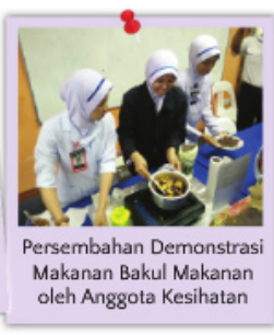
Persembahan Demonstrasi Makanan Bakul Makanan oleh Anggota Kesihatan

Pihak Yayasan Royal Widad telah memberi sumbangan murni berupa bakul makanan dengan anggaran jumlah peruntukan sebanyak RM176,000.00 selama 5 bulan secara NBOS kepada kanak-kanak kekurangan zat makanan di tiga daerah di Kedah iaitu Baling, Kota Setar dan Kuala Muda. Sumbangan tersebut diberi bagi membantu memulihkan kanak-kanak kekurangan zat makanan di tiga daerah berkenaan. Antara aktiviti yang dijalankan semasa majlis ini adalah demonstrasi masakan bahan bakul makanan oleh anggota Kesihatan dan pameran pemakanan.