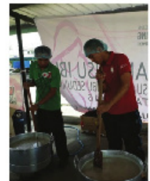
Proses mengacau bubur lambuk oleh kakitangan kesihatan JKWPL.

Aktiviti penyediaan bubur lambuk ini telah diadakan pada 14 Jun 2017 dan bermula seawal jam 8 pagi. Ia bertujuan untuk mengeratkan hubungan silaturrahim sesama kakitangan JKWPL. Ia juga merupakan salah satu pengisian bagi aktiviti Dapur Sihat Masyarakat JKWPL. Aktiviti ini telah disertai oleh wakil setiap unit/ seksyen di JKWPL. Bubur Lambuk Sihat yang telah dimasak diagihkan kepada setiap unit dan seksyen di Jabatan Kesihatan Wilayah Persekutuan Labuan (JKWPL).