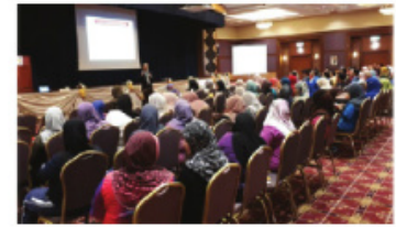
Seminar pengenalan Program Trim & Fit pada 19 Mei 2017 di Dewan Serbaguna, Kementerian Perdagangan Dalam Negeri, Koperasi dan Kepenggunaan, Putrajaya.