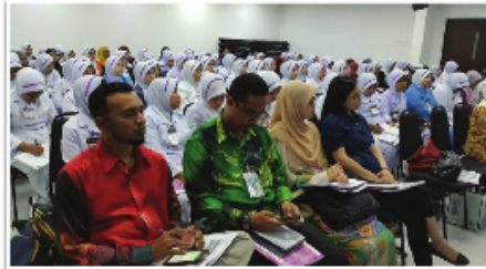
Sesi taklimat kepada anggota kesihatan di Zon Utara

Latihan kepada pasukan penyelidik telah dilaksanakan pada Jun 2016 yang lalu. Sesi taklimat turut dijalankan kepada anggota kesihatan yang terlibat iaitu Pegawai Perubatan, Pegawai Sains Pemakanan dan anggota kejururawatan. Sesi pengumpulan data oleh pasukan penyelidik telah dilaksanakan mengikut zon iaitu utara, selatan, timur, tengah, Sabah dan Sarawak bermula Julai hingga Disember 2016. Pada tahun 2017, kajian telah berada pada peringkat analisa data dan permulaan penulisan hasil kajian.