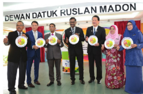
Datuk Seri Dr. S. Subramaniam dan Dato' P. Kamalanathan A/L P. Panchanathan Timbalan Menteri Pendidikan 1 menunjukkan Pinggan Sihat Malaysia bersama-sama dengan tetamu-tetamu kehormat yang lain.

Semasa Majlis Pelancaran, turut dirasmikan adalah Nutri Mart Pasaraya Sihat yang dihasilkan oleh Unit Pemakanan Jabatan Kesihatan Wilayah Persekutuan Kuala Lumpur. Selain itu, Guru Besar SK Setiawangsa juga berpeluang menunjukkan pelaksanaan program HiTS (Program Hidangan Berkhasiat di Sekolah) yang menggunakan konsep Suku Suku Separuh kepada semua tetamu terhormat.