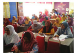
Peserta Latihan Katering Sihat Daerah Marang yang terdiri daripada Pembantu Pemaju Masyarakat Tabika KEMAS