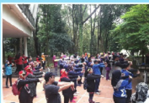
Program Walk n Hunt Trim & Fit pada 21 September 2017 di Taman Botani, Putrajaya.