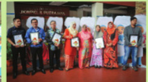
Wakil agensi yang menerima sijil pengiktirafan