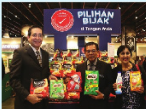
Dato' Seri Dr. Hilmi Bin Haji Yahaya, Timbalan Menteri Kesihatan Malaysia menunjukkan contoh produk dengan Logo Pilihan Lebih Sihat