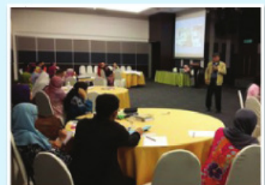
Gambar aktiviti semasa kursus dijalankan