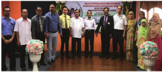
Sesi Bergambar Dengan Ketua Pegawai Eksekutif Yayasan Royal Widad Sebagai Penyumbang Bakul Makanan Kepada Kanak-Kanak Kekurangan Zat Makanan Di Daerah Baling, Kedah