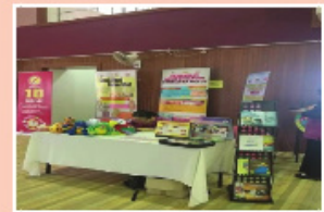
Antara pameran yang dijalankan di semasa Latihan tersebut