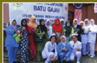
Sesi Latihan Praktikal Pegawai Penilai KRB Negeri Kelantan di Klinik Kesihatan Batu Gajah, Tanah Merah