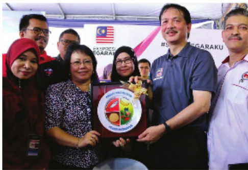
YBhg. Datuk Dr. Noor Hisham bin Abdullah bergambar kenangan bersama "Pinggan Sihat".

Unit Pemakanan Pejabat Kesihatan kawasan Sandakan telah mengadakan Pameran 'Suku Suku Separuh'. Pendekatannya menggunakan konsep SMART; (S) – Saringan Kesihatan, (M) – Makan Secara Sihat, (A) – Aktiviti Fizikal, (R) – Resipi Sihat dan (T) – Titik beratkan Keselamatan dan Kualiti Makanan. Healthier Choice Logo (HCL) juga telah diperkenalkan. Selain itu, pengunjung pameran juga telah dihidangkan dengan minuman sihat iaitu jus peria dan epal. Jus ini kaya dengan anti-oksidan yang bagus untuk anti penuaan, anti kanser dan mencegah penyakit kronik.