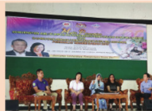
TALK SHOW : "Bersama Lestarikan Penyusuan Susu Ibu" atau "Sustaining Breastfeeding Together"

Sempena program ini, Roadshow PSI di lokaliti berhampiran dengan klinik daerah Kinabatangan dan Tongod telah dilaksanakan sepanjang bulan Julai dengan kerjasama AKSSI dan sukarelawan. Pelbagai pertandingan turut diadakan di kalangan AKSSI setiap daerah dan turut terbuka kepada orang awam. Pameran turut diadakan yang melibatkan pelbagai disiplin kesihatan seperti Pemakanan, Farmasi, Pergigian, Fisioterapi, Terapi Cara Kerja serta AKSSI setiap daerah yang memberi fokus kepada aspek PSI.