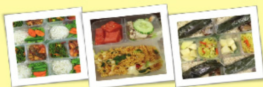
Contoh makanan Healthy Lunch Packed Meal yang ditempah oleh peserta Program Trim & Fit .

Majlis Penutup Program Pengurusan Berat Badan Trim & Fit IPKKM 2017 telah disempurnakan oleh Dato' Hasnol Zam Zam Ahmad, Timbalan Ketua Setiausaha (Pengurusan), Kementerian Kesihatan Malaysia pada 4 November 2017 sempena Trim & Fit Fun Run di Taman Wetland, Putrajaya.