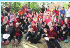
Sesi pendakian di Bukit Gasing, Petaling Jaya, Selangor pada 22 Julai 2017.