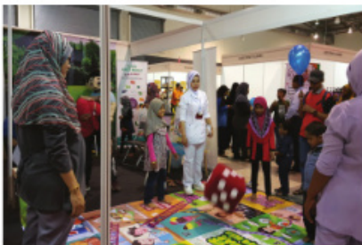
Permainan interaktif di Booth Pemakanan

Unit Pemakanan Jabatan Kesihatan Negeri Melaka telah terlibat secara langsung dalam menyampaikan mesej pemakanan yang memberi fokus kepada amalan pemakanan sihat sepanjang Expo Melaka Sihat 2017 berlangsung.