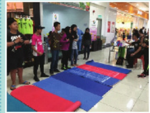
Peserta pertandingan "Plank it like you mean it!"