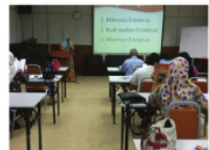
Ceramah Pemakanan oleh PSP di UiTM Dungun.