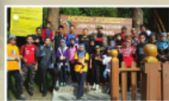
Stamina dan Kecergasan Pengurusan Berat Badan di Mossy Forest Gunung Irau, Pahang