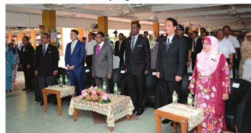
Tetamu- tetamu kehormat menyanyikan lagu Negaraku