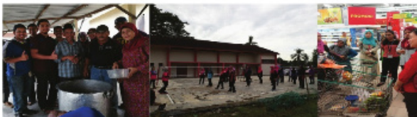
Program Bubur Lambuk Perpaduan Di Ijok Kuala Selangor

Antara aktiviti yang diadakan di seluruh negeri selangor di bawah program KOSPEN ini ialah saringan berat badan & peratus lemak, ceramah pemakanan sihat, aktiviti senamrobik, Memasak Bubur Lambuk Bernutrisi, Gameshow healthy food hunt & snack prepping di Pasaraya dan Taklimat KOSPEN-Amalan Pemakanan Sihat di Pusat Pemotongan Keluli JFE Shoji Steel Malaysia Sdn.Bhd.