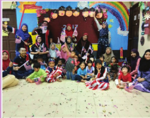
Jelajah Kemerdekaan 10 Ribu Langkah DSM dan Kelab Warga Emas Simpang Empat bersama PERMATA