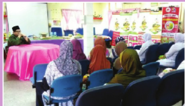
Mencegah Penyakit Tiga Serangkai di Bulan Ramadan dengan Pasaraya Sihat Mini- DSM dengan kerjasama Pejabat Mufti Perlis