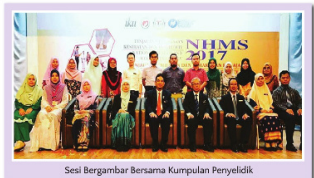
Sesi Bergambar Bersama Kumpulan Penyelidik

NHMS ialah satu kajian yang dijalankan oleh Institut Kesihatan Umum, Kementerian Kesihatan Malaysia untuk mendapatkan maklumat berkaitan status kesihatan masyarakat di Malaysia. NHMS dijalankan secara berkala mengikut keperluan semasa berdasarkan masalah kesihatan yang paling utama dan juga kumpulan sasaran. Bagi NHMS 2017, topik utama adalah tingkah laku berisiko yang menyebabkan masalah kesihatan dan amalan pemakanan di kalangan remaja di Malaysia.