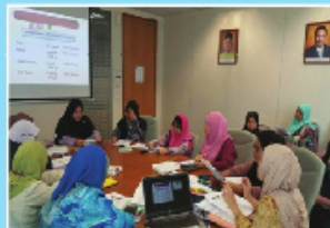
Sesi rundingcara pemakanan yang dijalankan setiap dua bulan oleh mentor bersama mentee.