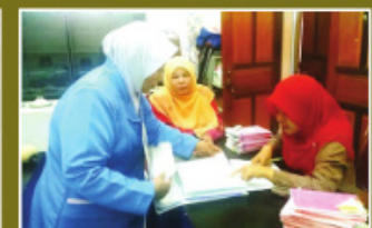
Sesi Latihan Praktikal Pegawai Penilai KRB Negeri Kelantan di Klinik Kesihatan Batu Gajah, Tanah Merah