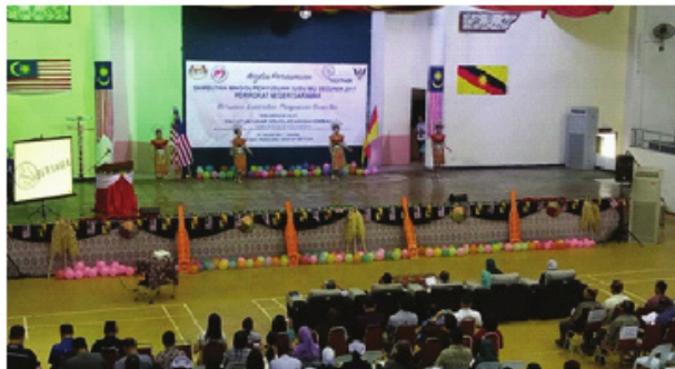
Persembahan tarian pembukaan oleh kakitangan kesihatan Bahagian Betong.