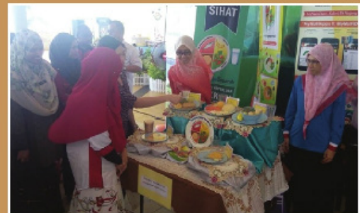
Lawatan ke Pameran Suku Suku Separuh di kawasan Rehat dan Rawat Bagan Ayam, Pulau Pinang