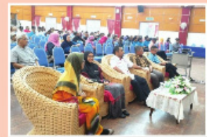
Ahli PIBG dari Daerah Rembau dan Port Dickson bersama-sama Pegawai Kesihatan Daerah tekun mendengar sesi taklimat yang diberikan.