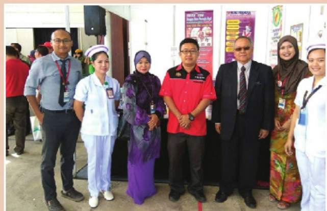
Bergambar kenangan bersama pegawai dan kakitangan JKN Sabah dan KKIA Kota Marudu