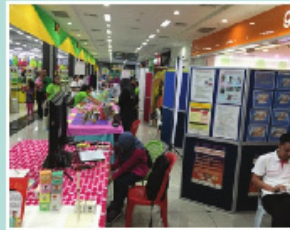
Pameran yang diadakan dalam ketika sambutan