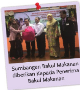
Sumbangan Bakul Makanan diberikan Kepada Penerima Bakul Makanan

Majlis Penyerahan Bakul Makanan oleh Yayasan Royal Widad Kepada Kanak-Kanak Kekurangan Zat Makanan telah diadakan pada 16 Ogos 2017 di Kompleks Belia dan Sukan, Baling, Kedah. Majlis ini dirasmikan oleh YBhg. Dato' Haji Othman bin Omar, Ketua Pegawai Eksekutif, Yayasan Royal Widad dan turut dihadiri oleh pihak Tabung Kebajikan Perubatan Malaysia.