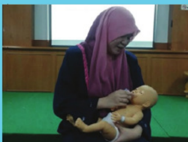
Demonstrasi Pemberian Susu menggunakan cawan / bekas ( Cup Feeding ) oleh peserta kursus.