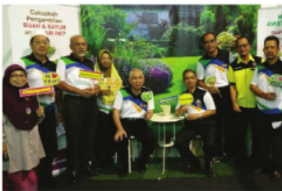
Lawatan VVIP ke Booth Pemakanan

Expo Melaka Sihat 2017 adalah acara tahunan Jabatan Kesihatan Negeri Melaka. Expo ini bertujuan memberi peluang kepada orang awam mengenali dengan lebih dekat peranan Bahagian Kesihatan Awam, Bahagian Perubatan, Bahagian Farmasi, Bahagian Pengurusan, Bahagian Pergigian dan Bahagian Keselamatan dan Kualiti Makanan Jabatan Kesihatan Negeri Melaka melalui aktiviti interaktif yang dijalankan. Expo ini juga memberi peluang kepada agensi swasta untuk mempamerkan perkhidmatan mereka untuk bersama-sama berganding bahu ke arah mencapai kesihatan yang optimum.