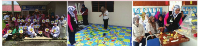
Peserta bergambar selepas Taklimat Pinggan Sihat Malaysia

Seminar Pemakanan Sihat Peringkat Negeri Selangor telah diadakan pada 30 Ogos 2017 & 9 September 2017 di Pusat Maklumat Pemakanan Negeri Selangor. Seminar ini telah dihadiri oleh anggota kesihatan, Sukarelawan KOSPEN Bukit Beruntung, Kelab Warga Emas KKIA Kuala Kubu Bharu, ahli Kumpulan Sokongan Penyusuan Susu Ibu Sabak Bernam & pelajar Management & Science University. Antara aktiviti yang diadakan semasa seminar ini adalah Ceramah Piramid Makanan Malaysia dan Taklimat Pinggan Sihat Malaysia Interaktif. Pelbagai permainan interaktif berkaitan pemakanan telah dijalankan iaitu Dam Makanan Sihat vs Kurang Sihat, Teka Kandungan Gula Dalam Minuman, Kenali Kumpulan Makanan Piramid Makanan.