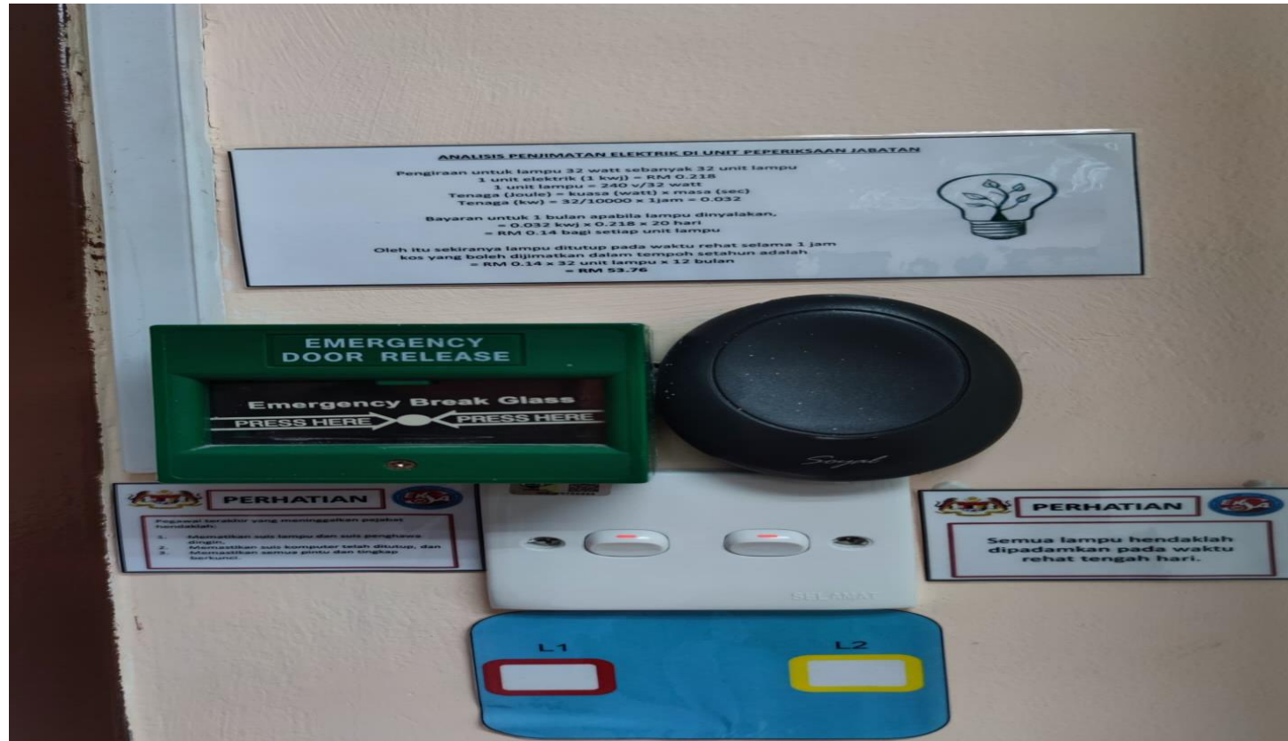
Analisis penjimatan elektrik yang dibuat